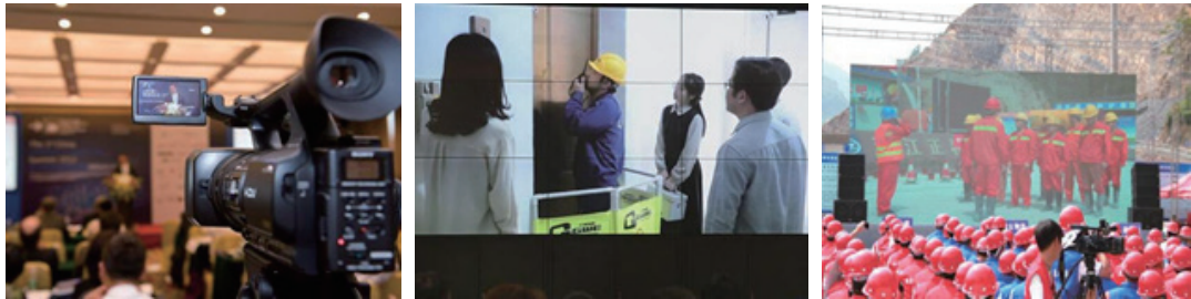
图9 应急演练直播现场图