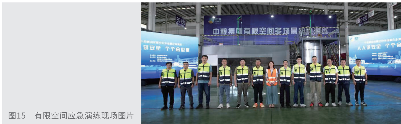
图15 有限空间应急演练现场图片