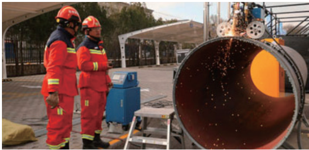
图4 有限空间应急演练