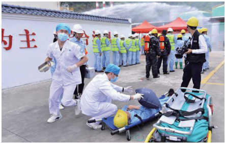
图2 反恐、防爆应急演练