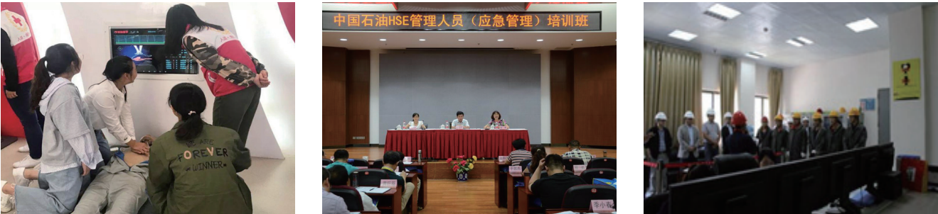
图12 应急培训现场图

为保障应急演练正常进行,我们为企业提供专业多样的应急安全产品,助力应急救援、提升应急安全管理。