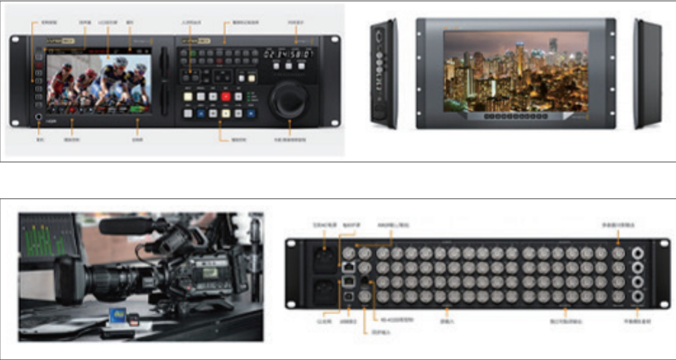
图16 应急演练现场转播设备(部分)

技术层面：中建协认证中心现有各类广电级摄录设备，即时现场多角度，多机位现场转播、制作、播出等全流程音视频服务，低延时无线传输设备，公网专网类编解码终端，可实现多种场景下的应急演练音视频回传。多场地、跨区域、跨层次、跨部门、灾害模拟场景的音视频互动，全方位、多角度反映突发事件应急响应全过程，生动有效展现演练前后方应急指挥、决策部署、协调调度、应急救援等实施过程，切实实现贴近实战、提升能力、教育培训的目的要求。