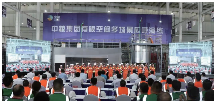
图14 有限空间应急演练现场图片

中建协认证中心全程参与并参与了应急预案、应急演练方案设计、应急演练脚本的编写、导演道具安排、演练现场布置、过程录制与转播、新闻稿的编制与发布。