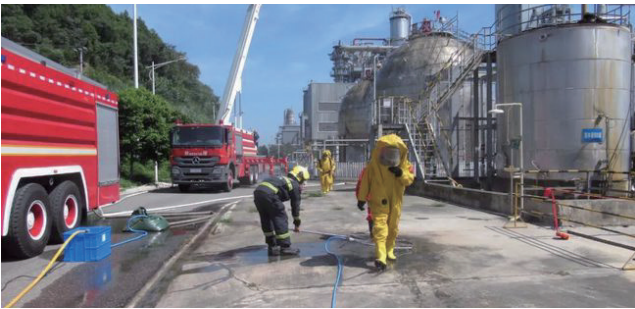
图3 化学品泄漏演练

为企业提供危化品泄漏、有限空间、防汛应急、有限空间事故等专项应急演练服务，为企业提供应急演练、演练直播、演练视频、预案修编、演练动画、应急培训等全流程服务。切实帮助企业提升应急水平。