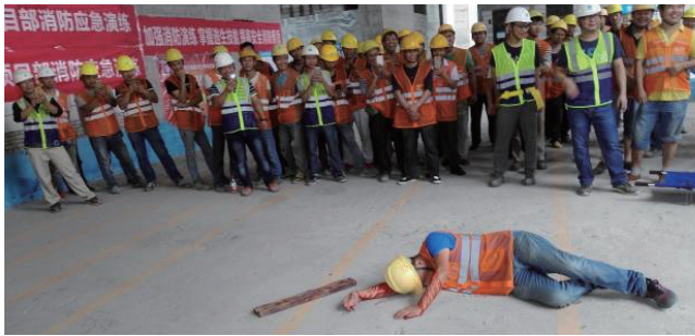
图8 施工现场消防应急演练